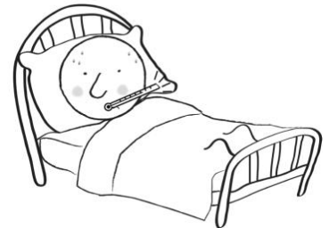
Quédese en casa si está enfermo

¡Pregúntele a su doctor sobre la vacuna contra la gripe!