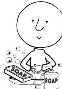
Lávese las manos