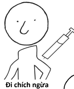
Đi chích ngừa