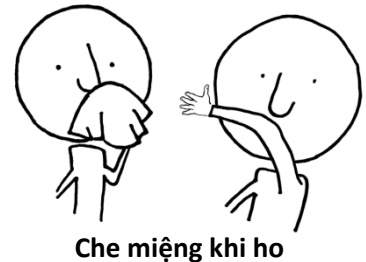
Che miệng khi ho